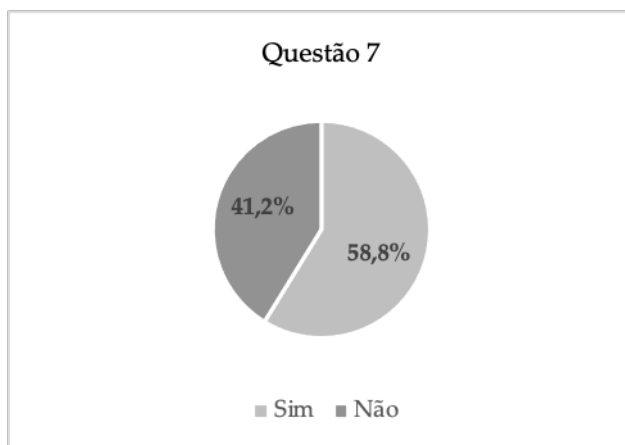
Gráfico 1 (In)visibilidade da agressora sexual